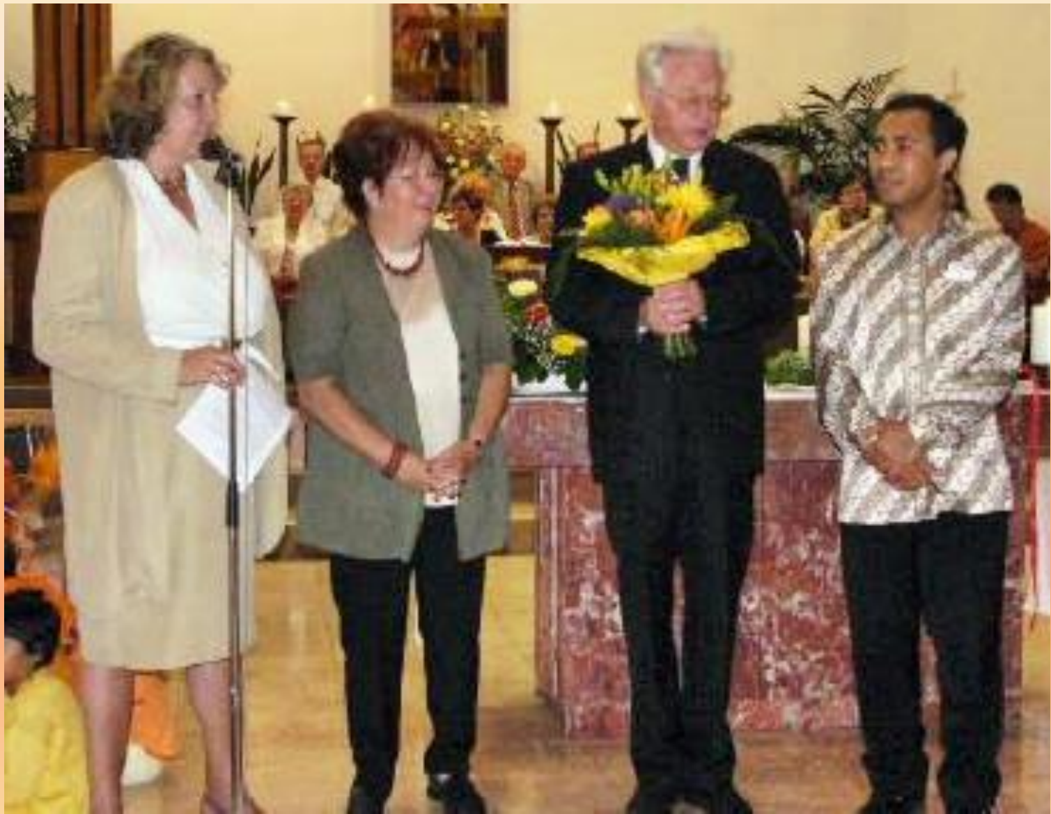
Installation des Leitungsteams